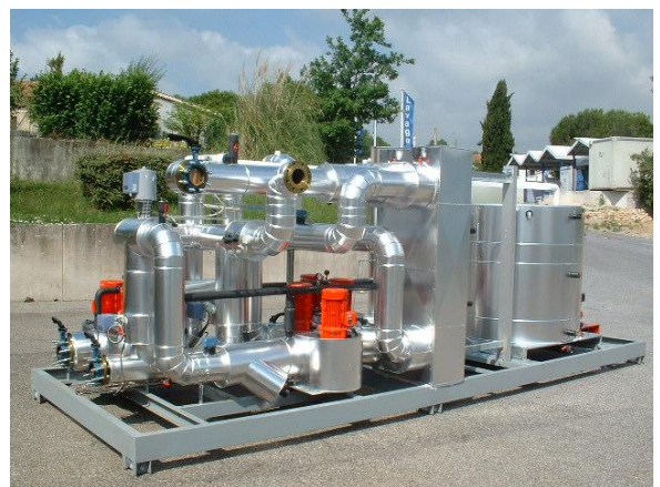
Exemple de réalisation possible

Le principe de stockage de froid par chaleur latente liquide/solide est ici privilégié afin de permettre une très forte densité de stockage thermique (réduction maximale du volume de stockage) et une efficacité énergétique maximale de la machine frigorifique grâce à une température constante d'accumulation d'énergie.