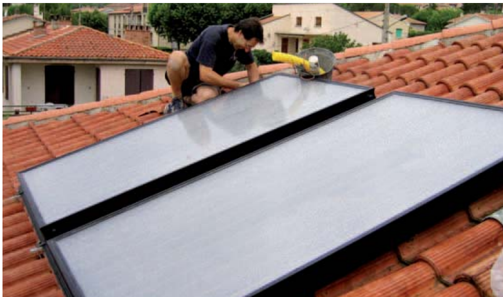
Installation solaire thermique