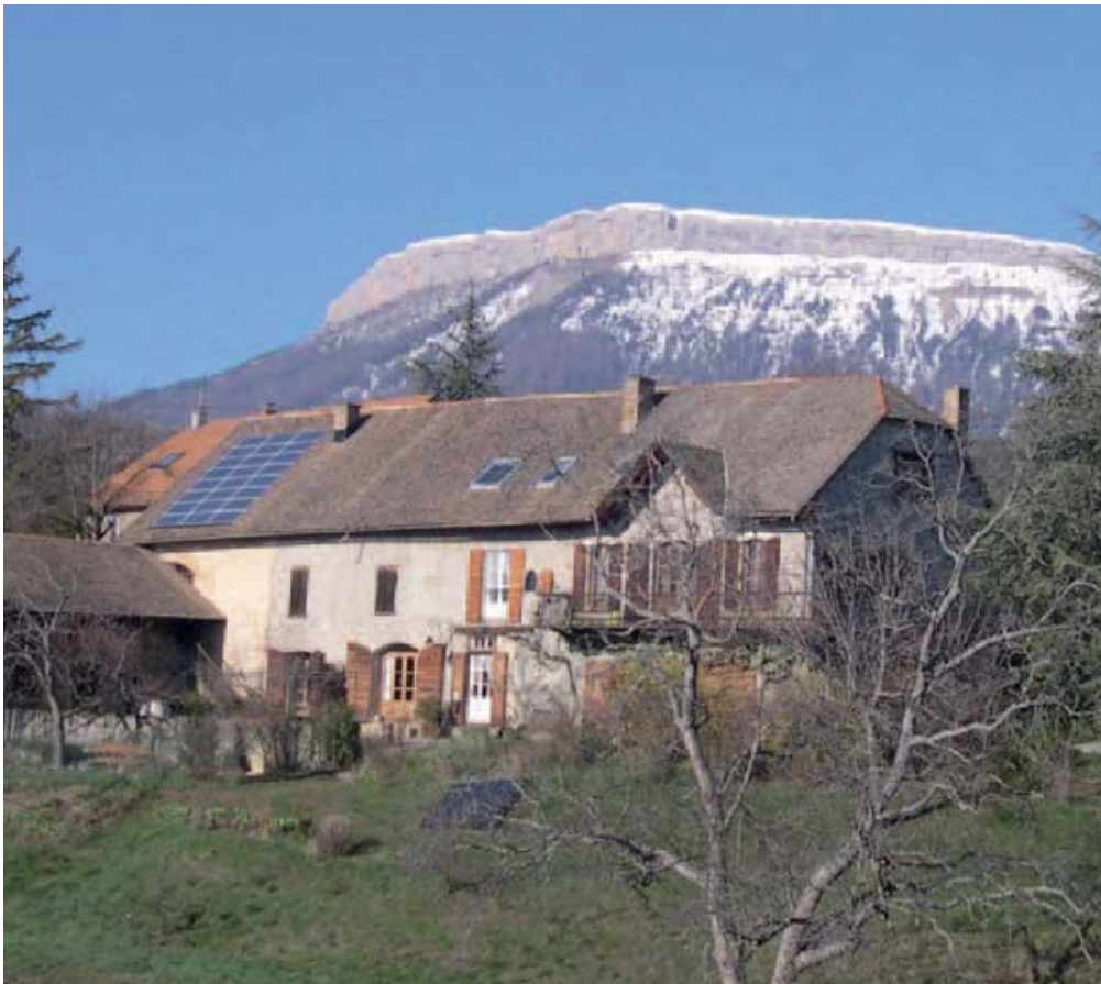
Installation solaire photovoltaïque