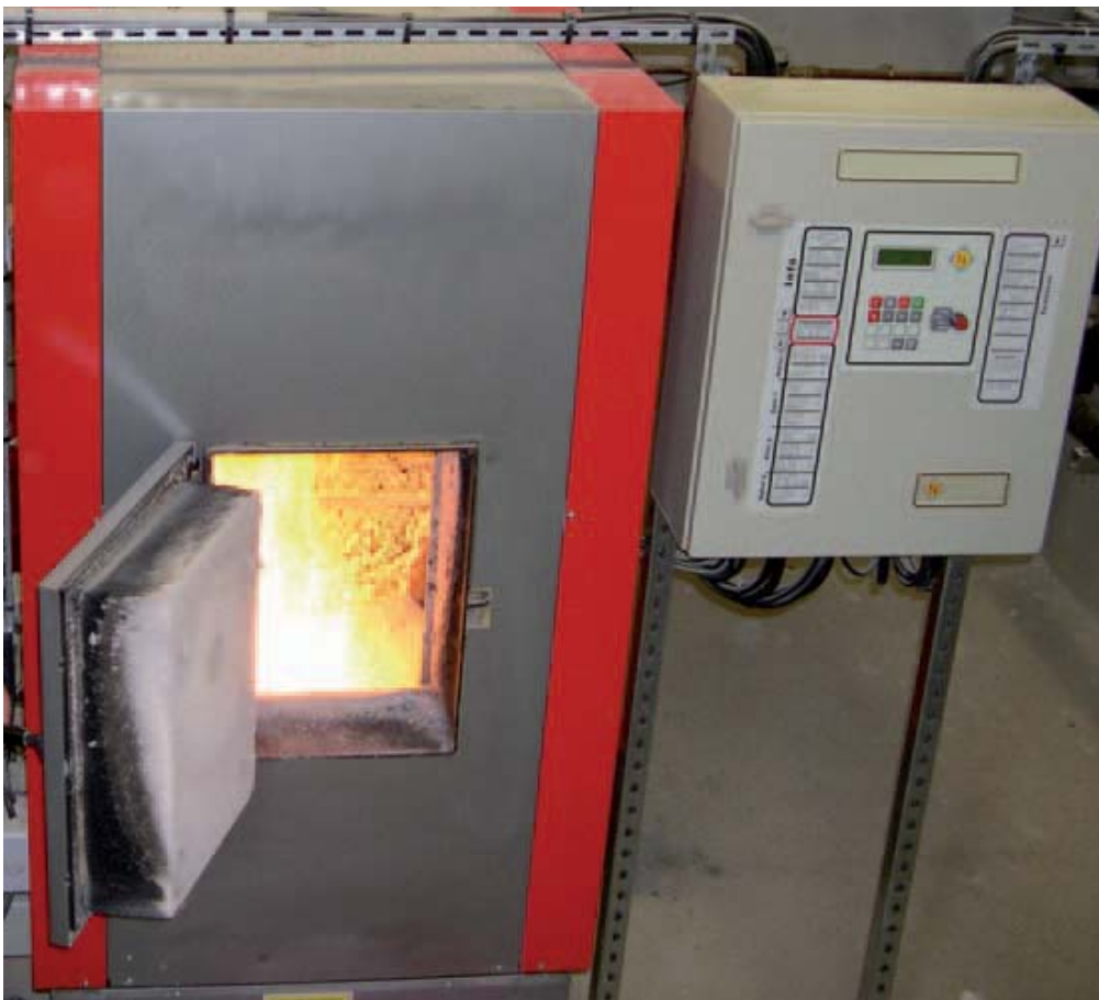
Chaudière à bois déchiqueté